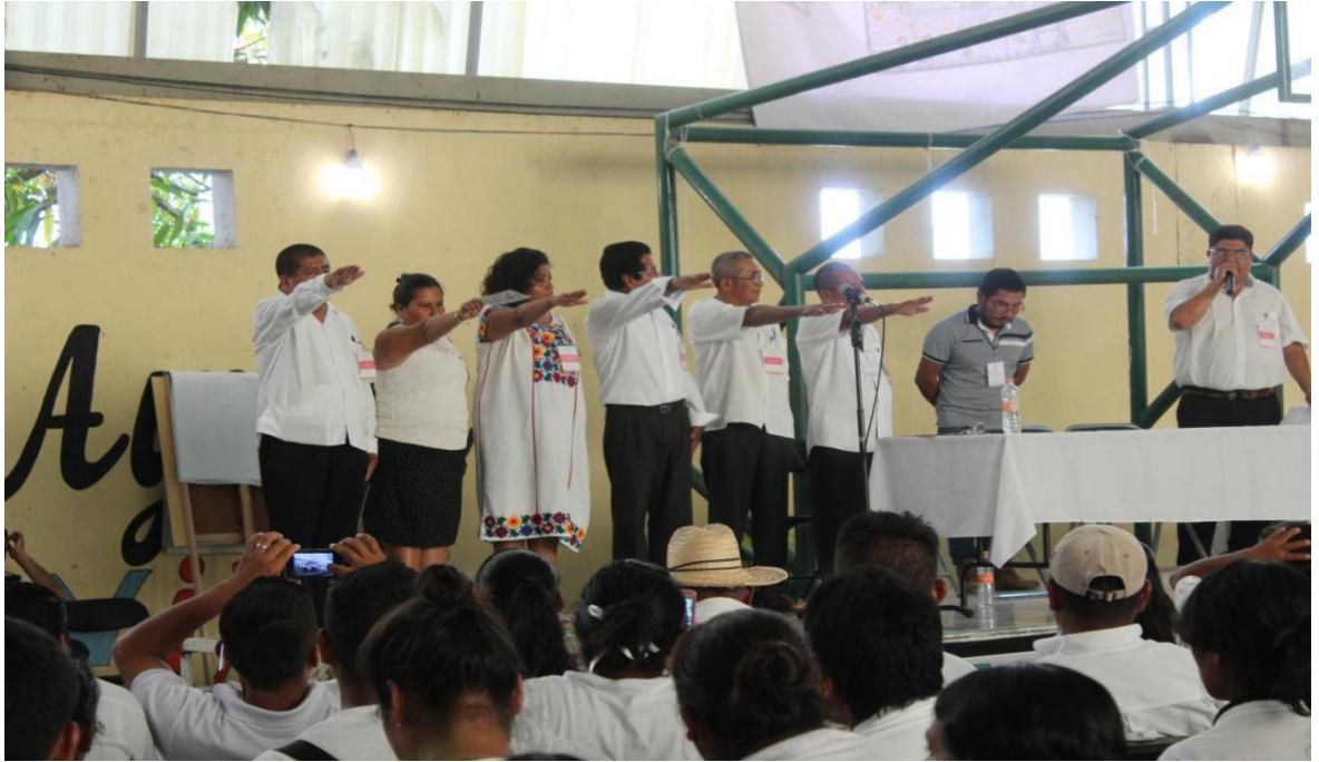
Imagen 4. Toma de protesta, Concejo Municipal Comunitario